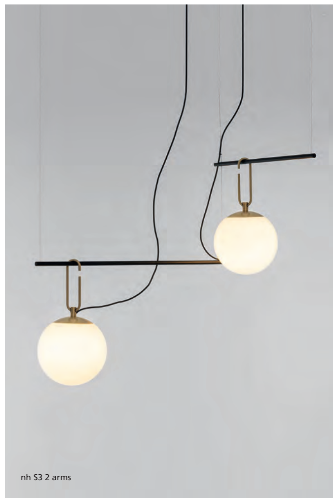
nh S3 2 arms