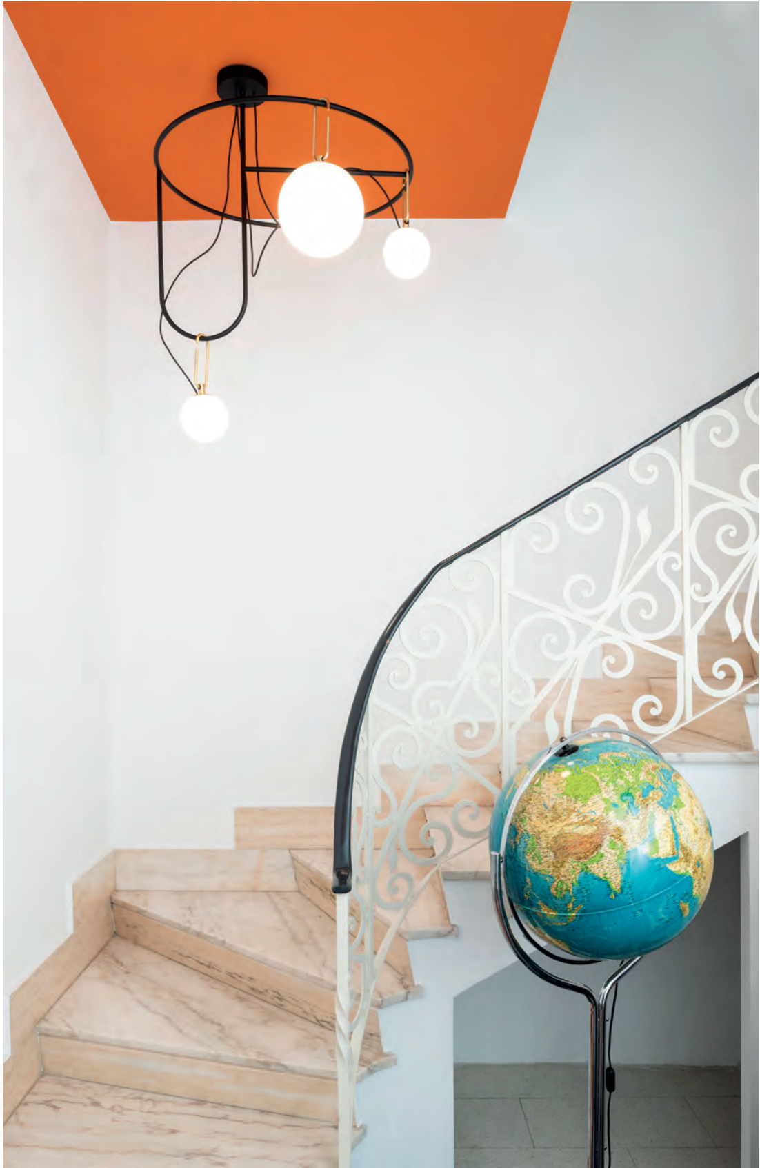
nh S4 circulaire