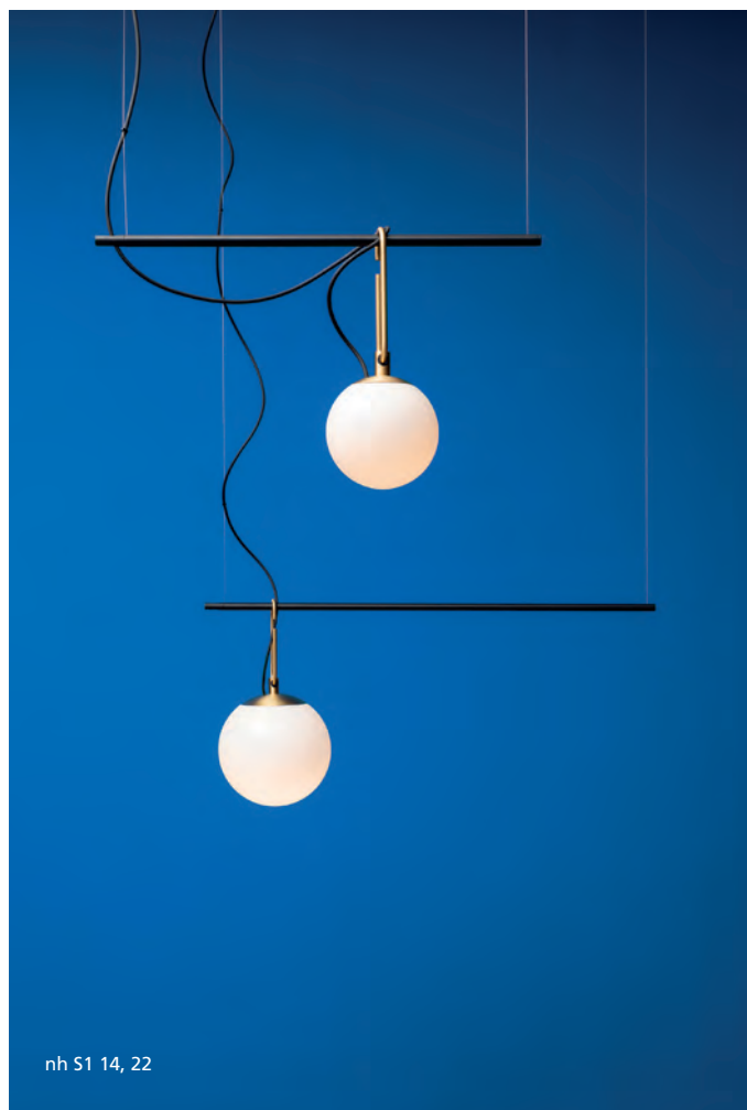
nh S1 14, 22

nh S3: 936 x 1175 x Ø137 ceiling rose x min 1172 - max 2172h nh S3 2 arms: Ø220 x 403 diffuser x 1340 x Ø137 ceiling rose x 1266h