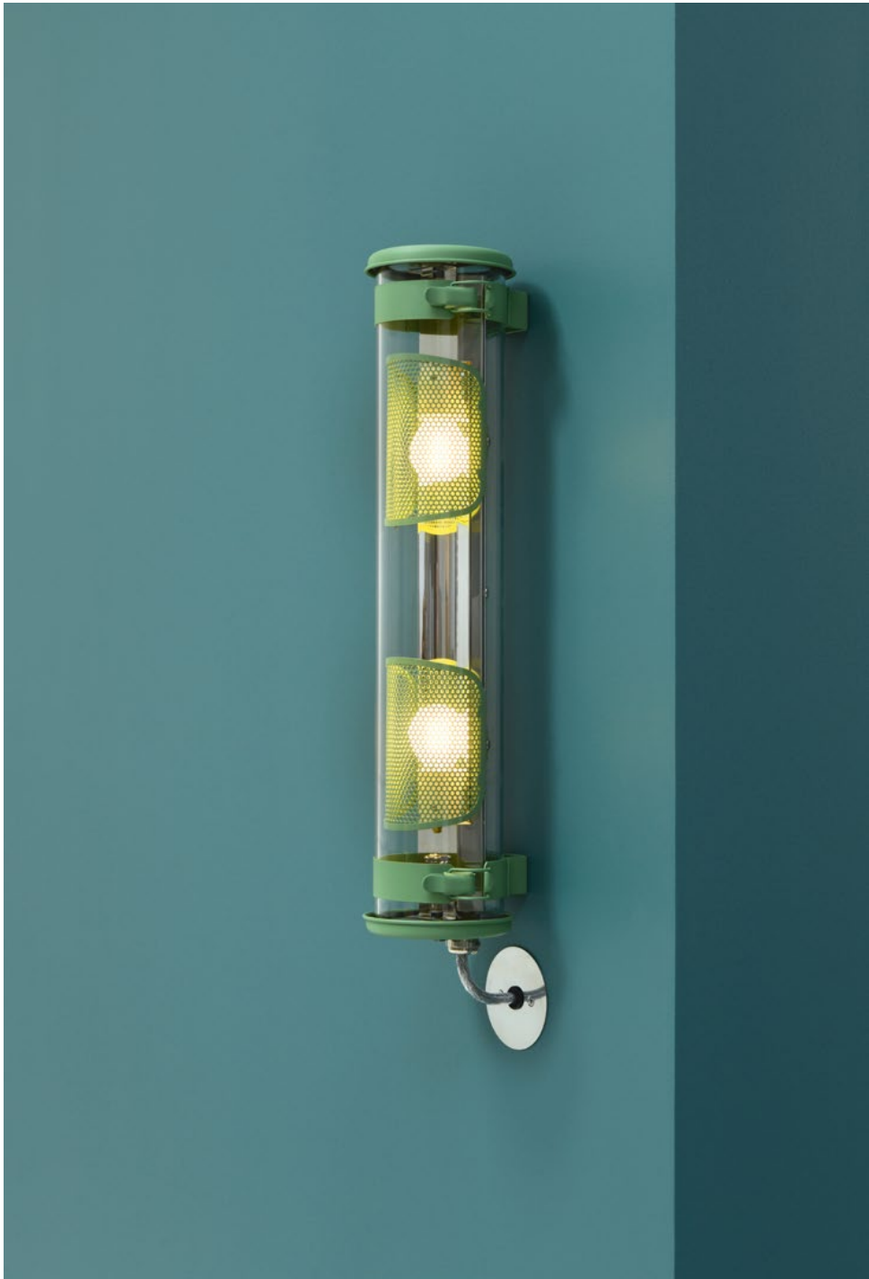
Musset GR Provence Silver