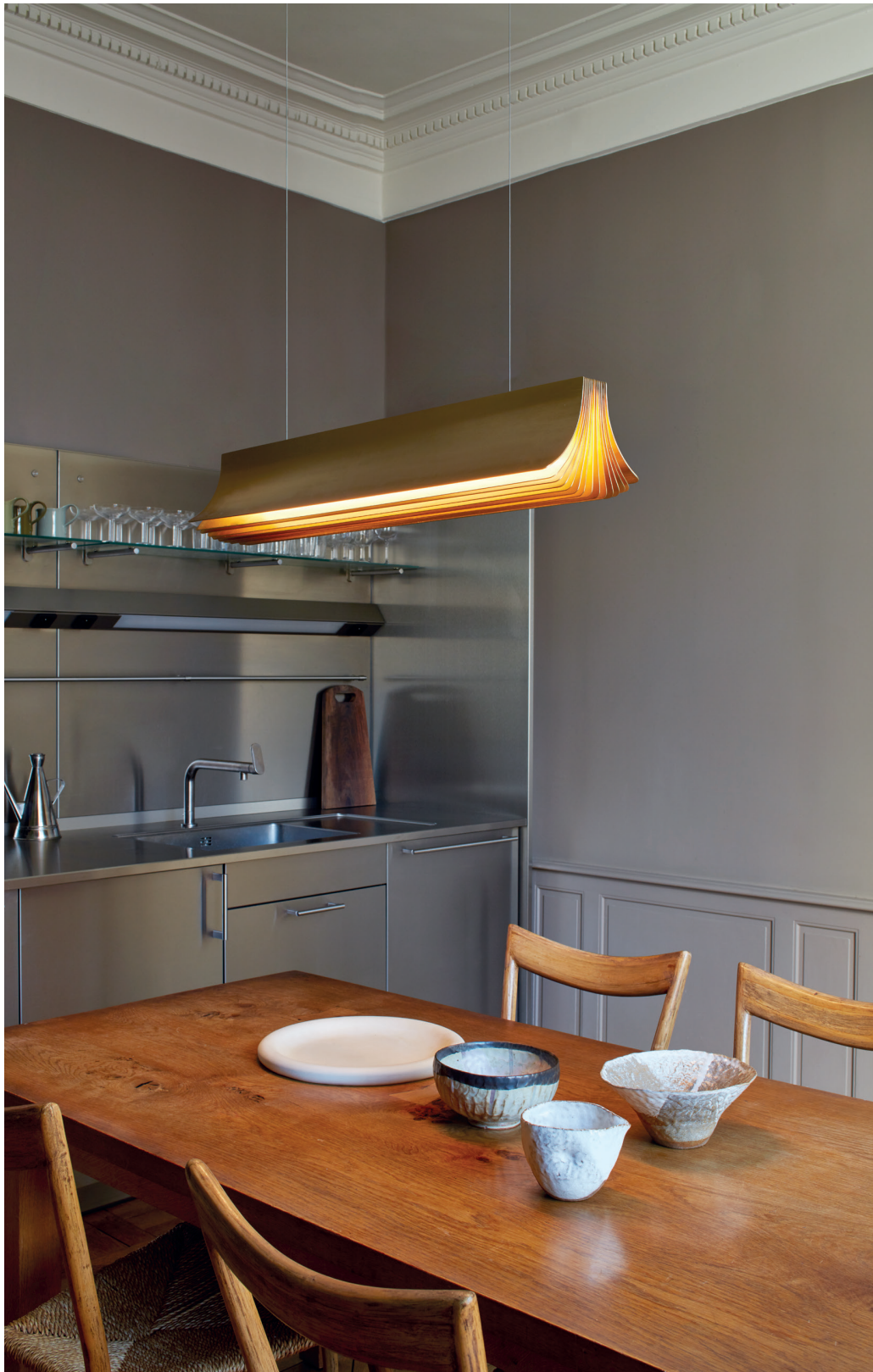
Left page RESPIRO PENDANT 2