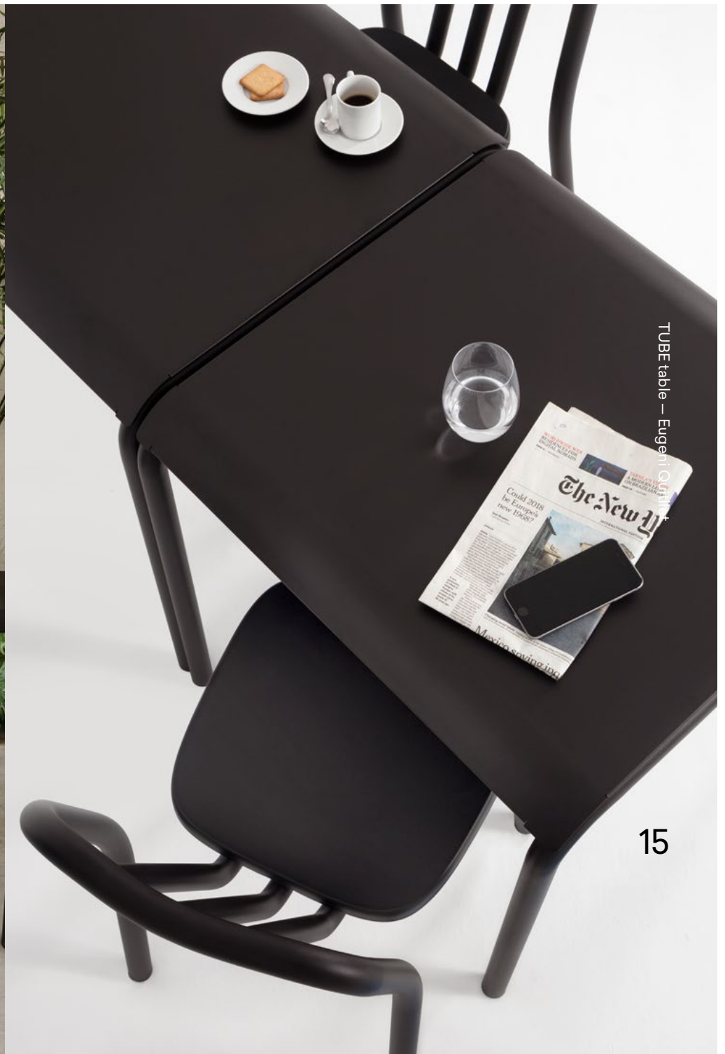
TUBE table – Eugenio Quattrone