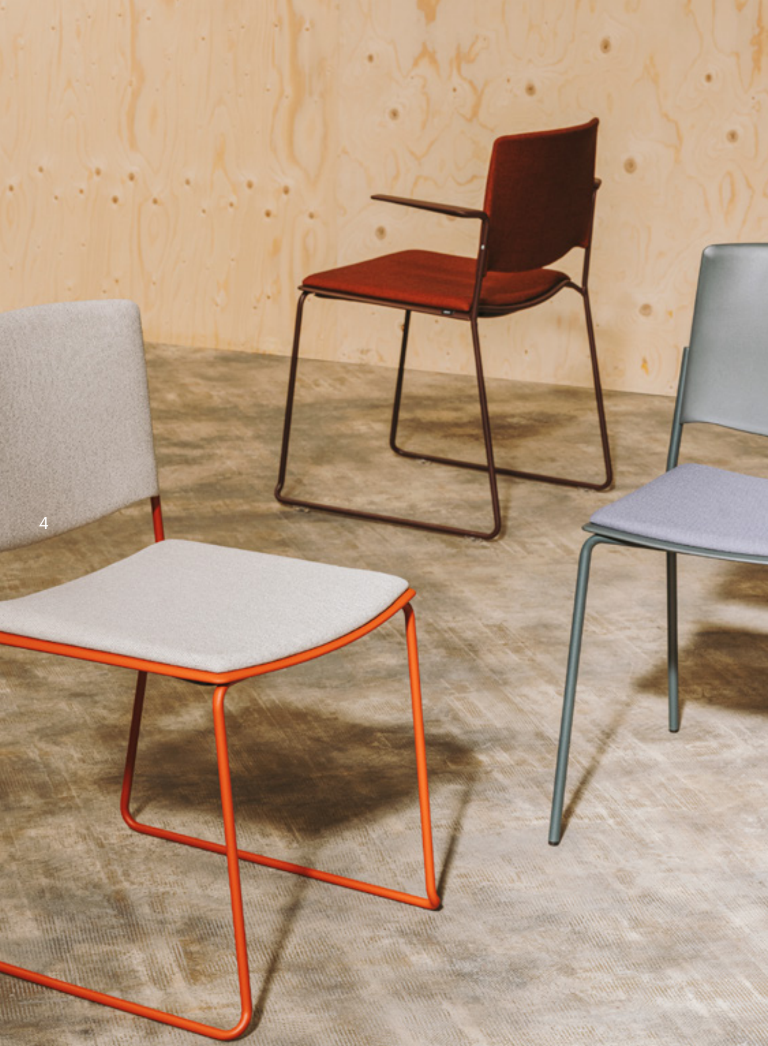
In both pictures: Ema 4L Pantone 5753 on Olive frame. Ema with seat pad and back upholstered in Gabriel Chili 61174 on sled with arms frame in Pantone 4975 Wine. Ema with seat pad and back upholstered in Gabriel Swing 52005 on sled frame Pantone 174 Teja. Ema 4L with seat pad upholstered in Gabriel Chili 60081 with back and frame in RAL 7016 Anthracite.