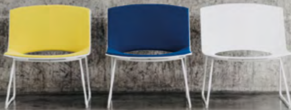
Lounge Chair, Table