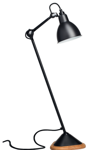
Table lamp | Lampe de table