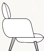
Ⓢ B010 Poltrona con poggiatesta Armchair with head-rest Fauteuil avec repose-tête Armlehnsessel mit Kopfstuetze