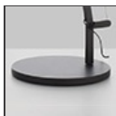
Demetra LED T Base NRO 1733040A