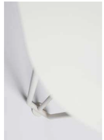
Rambla table Martín Azúa