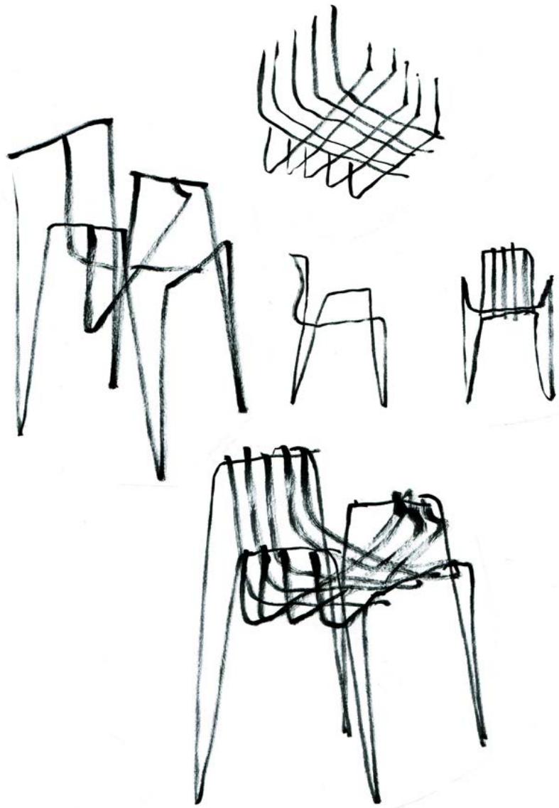
Sketches made by Martín Azúa.