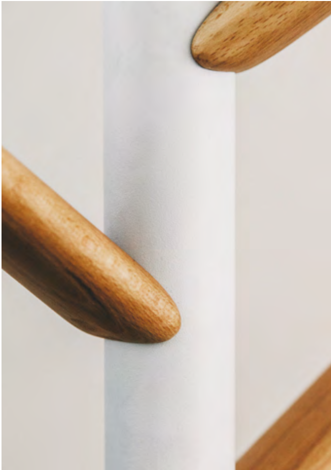
On the right: Caddy coat stand (ref. 9530), lacquered in Pantone 5753 C and hooks in natural wood.