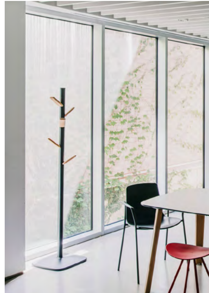
Caddy coat stand (ref. 9530), with natural wood hooks and structure in RAL 9016.

Su estilizado diseño de formas curvas está concebido para ejercer un impacto mínimo en las prendas colgadas.