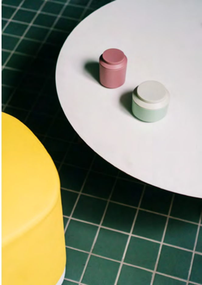
Puck (ref. 9500), lacquered in RAL 9005 and upholstered in Hemp HWP16 and lacquered in RAL 9016 and upholstered in Hemp HWP14.