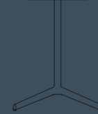
CIRCULAR TOP H 720 Ø 600/700/800/900