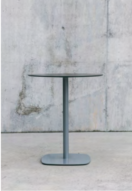
Lottus table (ref. 4912) lacquered in RAL 7004 and black HPL top.