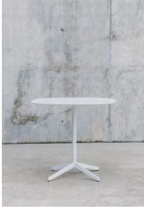
Lottus AL table (ref. 4947), lacquered in RAL 9016 and white Fenix top.

Lottus tables come in four height options: occasional, standard, café, bar. The post base has a choice of 12 paint colours, while the different sized and shaped tops are available in solid phenolic resin with veneer or laminate surface.