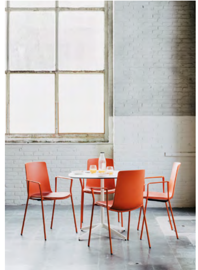
Lottus AL table (ref. 4947), lacquered structure in RAL 9016 and white HPL top. Lottus High (ref. 6200).