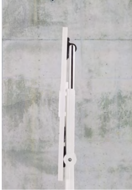
Folio table (ref. 6010) with a RAL 9016 lacquered structure and top in White melamine.