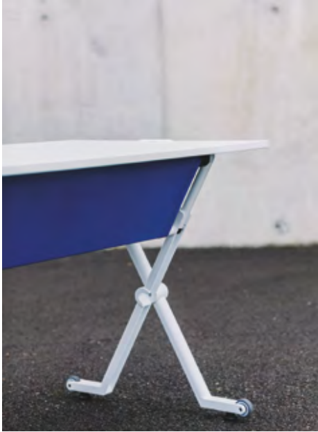
Folio table (ref. 6002) with RAL 9016 lacquered structure and top in White laminate, used with Folio panel (ref. 6007) upholstered in Xtreme Plus YS035.