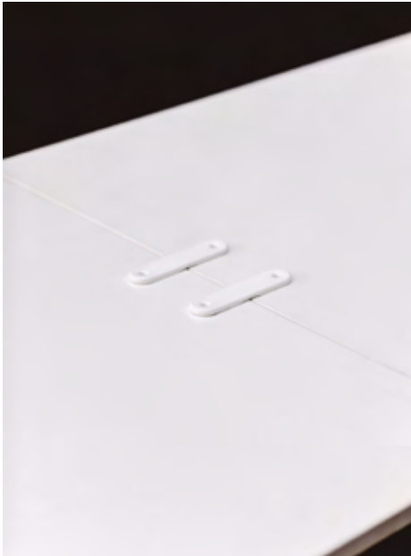
Table connectors in RAL 9016 polypropylene.

Its flexibility and manageability means anybody can fold and move the Folio tables easily with one hand, stack them in the desired place of storage, or transport them easily on the optional trolley. The outcome is huge savings in assembly, disassembly and storage. It also come with its own transport trolley and other accessories.