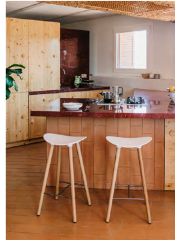
Coma Wood (ref. 2095), in oak legs and upholstered in Hallingdal 596 and 526 with LTS System (ref. 4972).

Las opciones de tapicería ofrecen una sensación más cálida, sin renunciar al minimalismo de Coma.