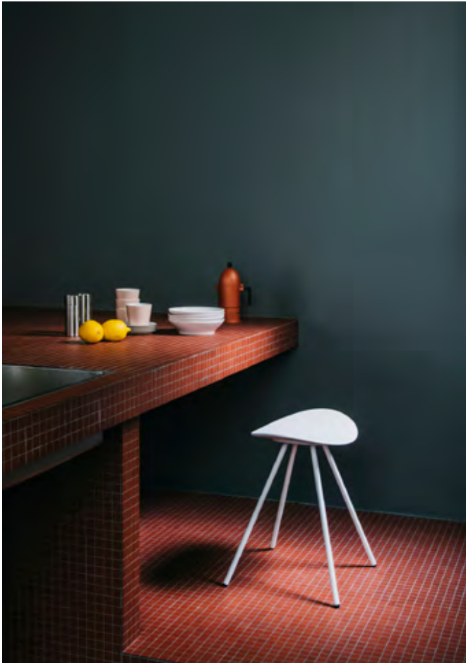
Coma 4L (ref. 2096) in monochrome RAL 9016.