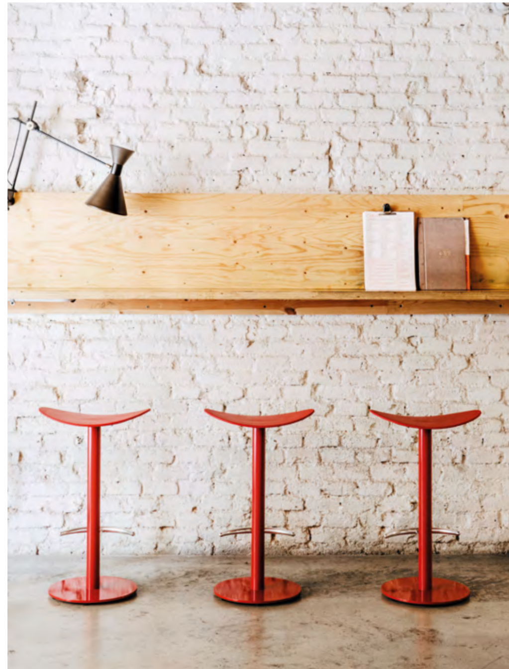
On the right: Coma stool (ref. 2004) in Pantone 4975C monochrome.