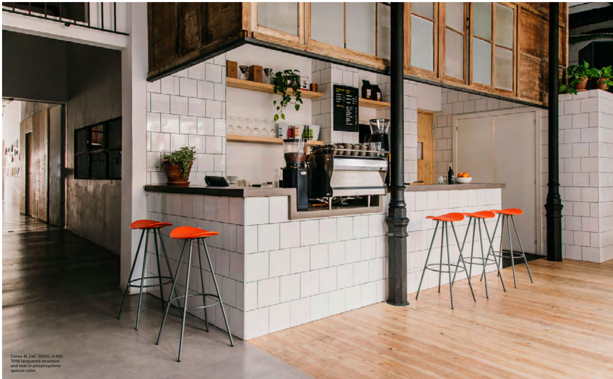
Coma 4L (ref. 2050), in RAL 7016 lacquered structure and seat in polypropylene special color.