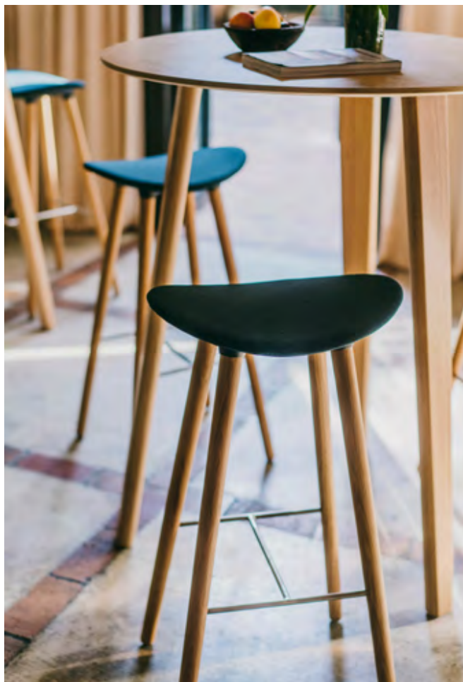
Coma wood stool (ref. 2091) with oak legs and seat upholstered in Steep Melange 68158. High table LTS System (ref. 4977), in oak.

Coma Wood transmite elegancia y calidad con una sólida ingeniería.