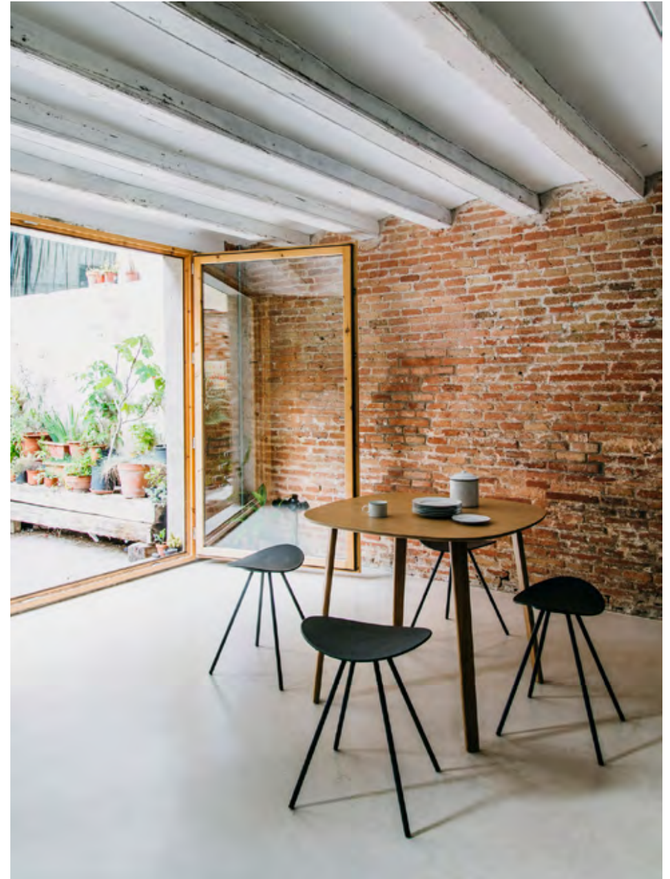
On the right: Coma 4L (ref. 2096) in monochrome RAL 9005 with LTS System table (ref. 4974) in oak.