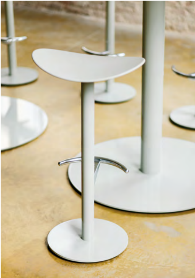
Coma stools (ref. 2000) in RAL 7032 monochrome.