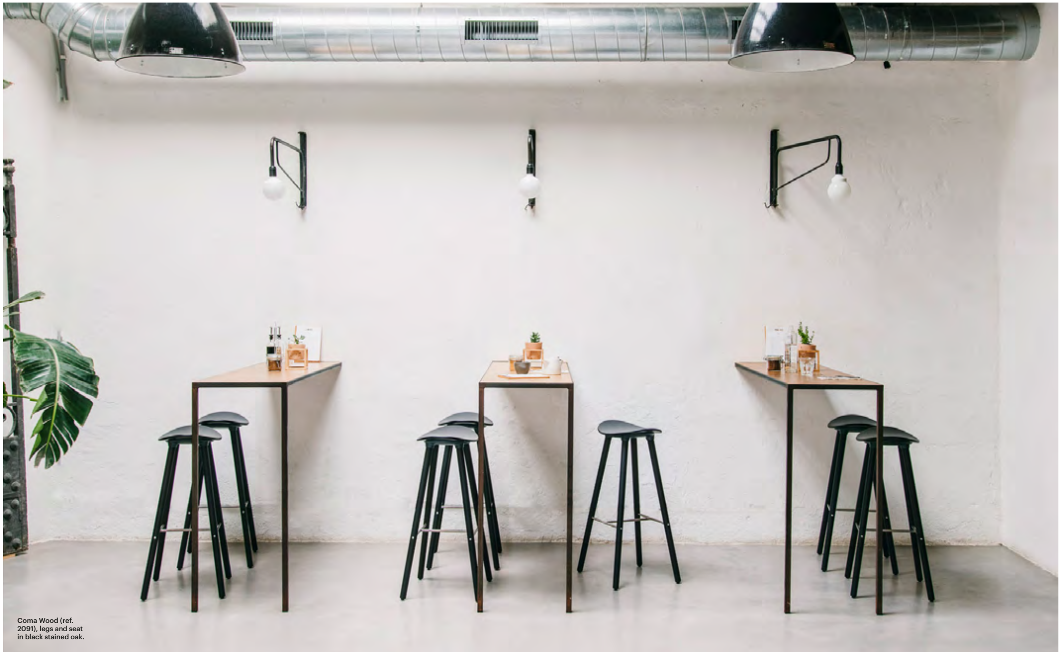
Coma Wood (ref. 2091), legs and seat in black stained oak.